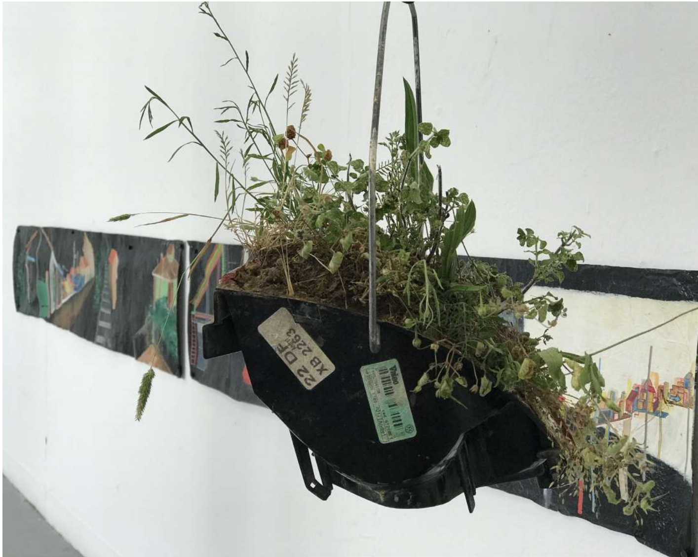
Cela ne tient plus qu'à un fil , 2018 Potence en métal, câble électrique, phare arrière de voiture, végétations. 138x26cm