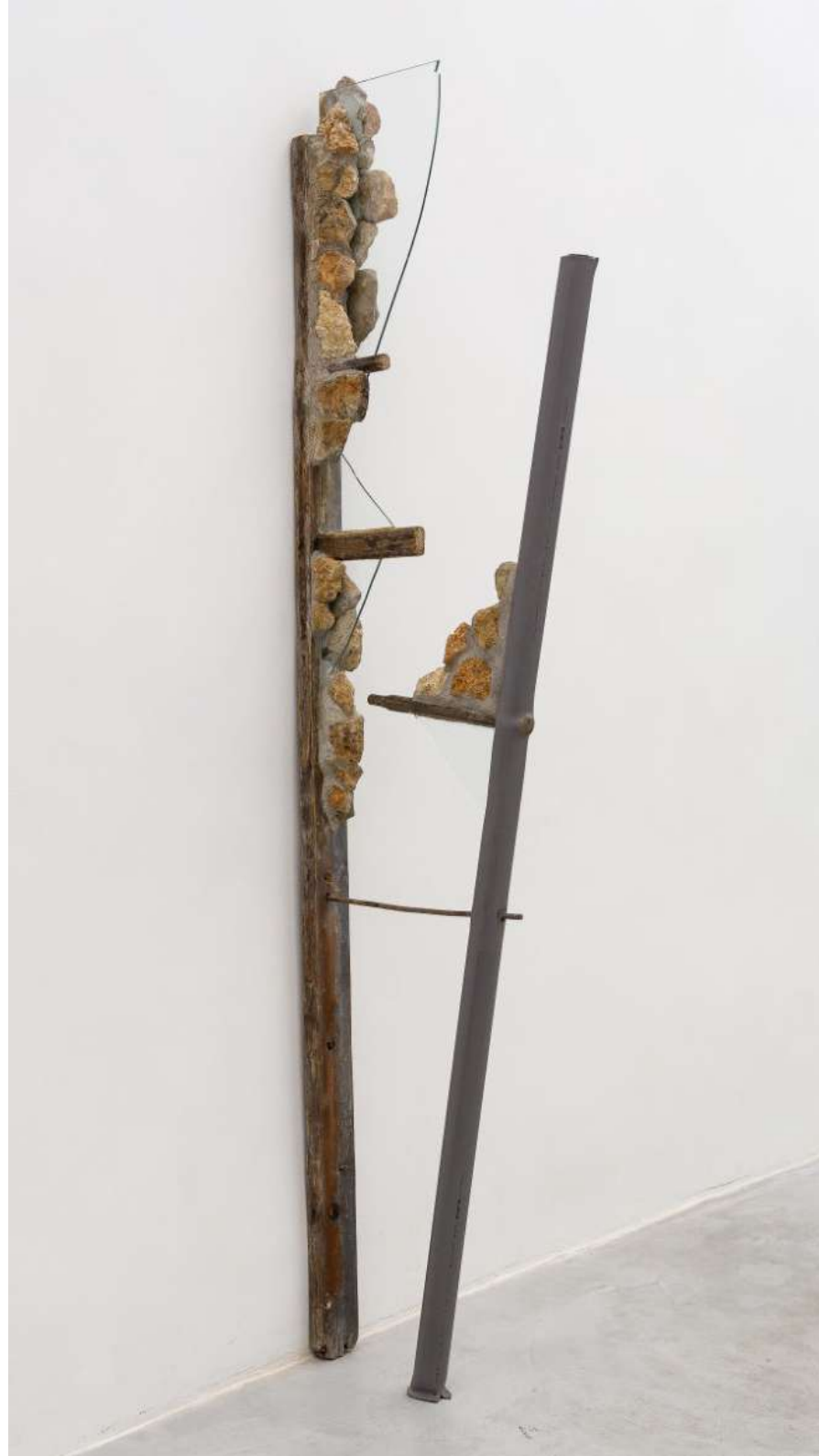
Mise à l'échelle, 2022 Série « les extractions » Bois, pierre, pvc, verre 192x10x50 cm