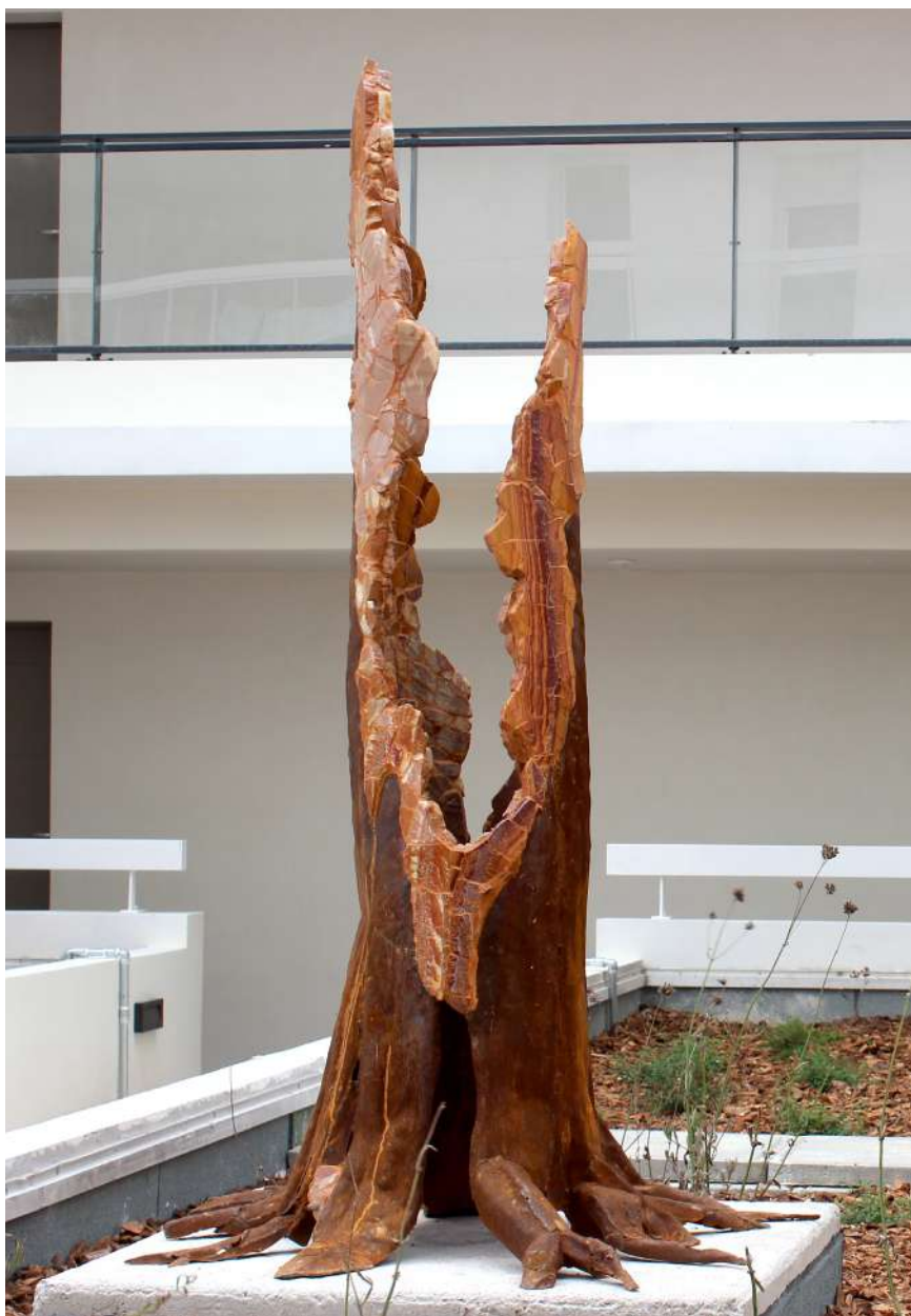
Écho, 2021 Acier corten, marbre Onyx rouge, colle ciment. 180x45 cm